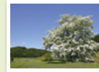
久須見のひとつばたご

魅力ある市街地、歴史史跡や農村・東濃牧場のある高原地帯など様々な姿を持つこの町を、もっと住み良い元気なまちへと展開していきます。