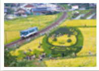
田んぼアートと明知鉄道

澄んだ空気と豊かな自然から生まれる山岡の細寒天。体も健康、地域も元気な健康の里づくりに取り組んでいます。