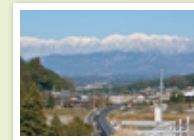
中央アルプスを望む

懐かしい里山や中央アルプスを望む景観を満喫! 田舎ならではの魅力が詰め込まれた田舎体験交流、軽トラ市、里山整備事業などを展開しています。