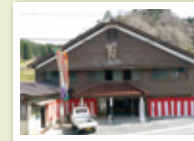
歌舞伎小屋 五毛座

市内で最も人口減少が進む“天空の里”飯地。移住・定住を受け入れていくために、居住環境の整備、子育て支援、地域の魅力発信に取り組んでいます。