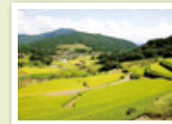
棚田100選の坂折棚田

めざせ栗園日本一、坂折棚田の保全、みんなの福祉をまちの活力に、脈々と受け継がれた歴史と文化を伝える郷土資料館を作りたい応援をお願いします。