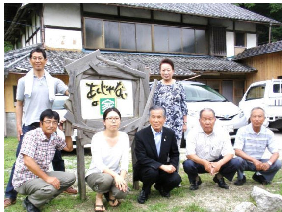
可知市長も視察にみえました(7/5)

あんじやないの家オープン 棕実地区にて「あんじやないの家」の開所式が、六月二十八日に行われました。式には三郷町内外から改修工事にかかわった多くの方が参加されました。 式では、所有者の許諾をもらい、改修組織を立ち上げ、補助金を受け、リフォーム講座を開き…と、完成に至る経緯が紹介され、参加したみなさんは工事の思い出を語り合っていました。